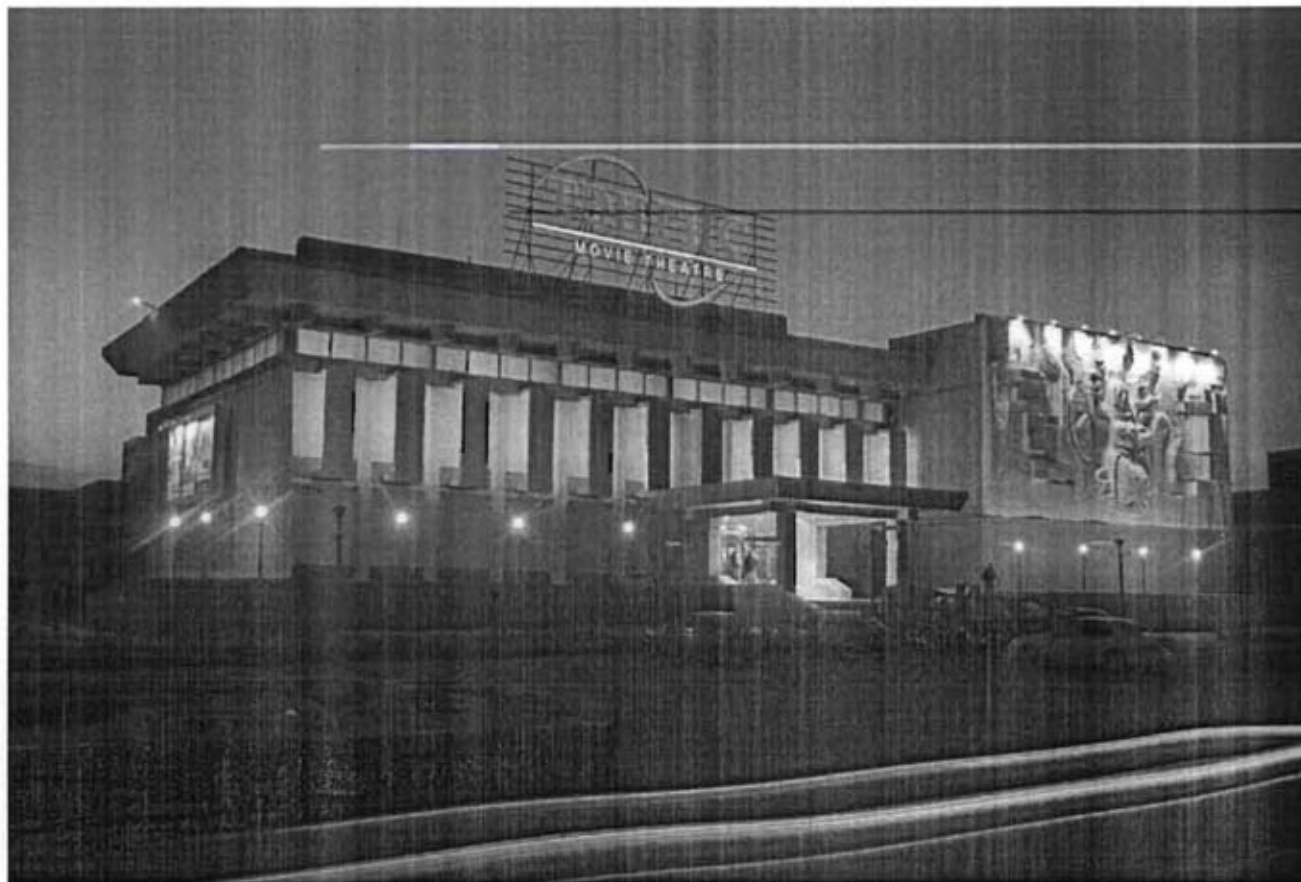
“Улаанбаатар синема” ХХК-ийн “Тэнгис” кино театр /2003 он/