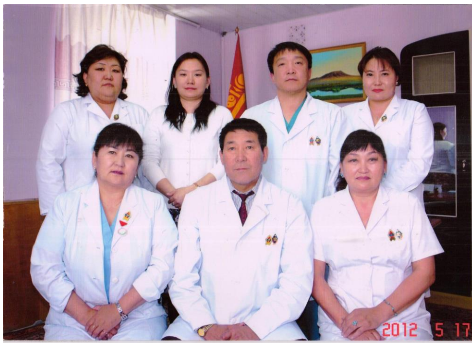
ШЭНЭСТөвийн Захирлын зөвлөл /2012 он/

Манай эмч, ажилтануудын 75 хувь төрийн болон эрүүл мэндийн салбарын шагналаар шагнагдсан ба “Эрүүлийг хамгаалахын тэргүүний ажилтан” цол тэмдгээр-12, Нийслэлийн Эрүүл мэндийн “Тэргүүний ажилтан”-21, “Хөдөлмөрийн хүндэт медаль”-1, Эрүүл мэндийн яамны “Хүндэт жуух”-11, Нийслэлийн Засаг даргын тамгын газрын болон Эрүүл мэндийн ажилтаны Үйлдвэрчний холбооны шагналаар-15, Залуучуудын холбооны “Тэргүүний залуу” алтан медаль болон Улаан загалмай, Сувилахуйн шагналаар шагнагдсан тэргүүний эмч, эмнэлгийн ажилчид ажиллаж байна.